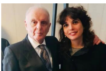
avec Daniel Barenboim