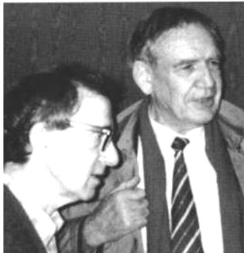
Avec Woody ALLEN

Considéré comme le clarinetiste et le chef d'orchestre le plus proche de la tradition de la Nouvelle Orléans, Claude Luter, par sa fougue, son enthousiasme flamboyant, son inspiration et sa sincérité, est l'un des rares jazzmen non américains à être entré au Panthéon des musiciens de renommée mondiale.