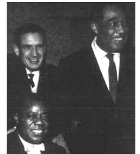
Avec Louis ARMSTRONG & Duke ELLINGTON

Aux premiers disques, réalisés à titre privé et vendus aux amateurs du Lorientais, succède un contrat avec « Swing » en 1947. Les choses viennent de prendre un tour sérieux, les enregistrements de disque s'enchaînent pour Claude Luter et sa formation.