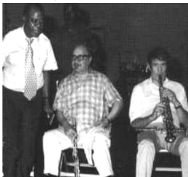
Avec Louis ARMSTRONG & Barney BIGARD

L'admiration qu'il porte à Johnny Dodds, sera pour Claude Luter la première influence marquante d'une carrière toute entière soumise à de très fortes amitiés musicales. Dans la majorité des cas, elles auront l'occasion de se réaliser à travers de jam-sessions, les plus grands jazzmen mondiaux venant au Lorientais retrouver une partie de leur propre jeunesse.